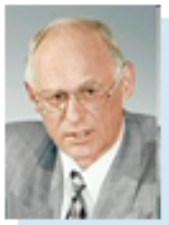
Председатель Попечительского Совета Негосударственного пенсионного фонда «Образование и наука» Бальхин Григорий Артемович — Председатель Комитета Госдумы РФ по образованию